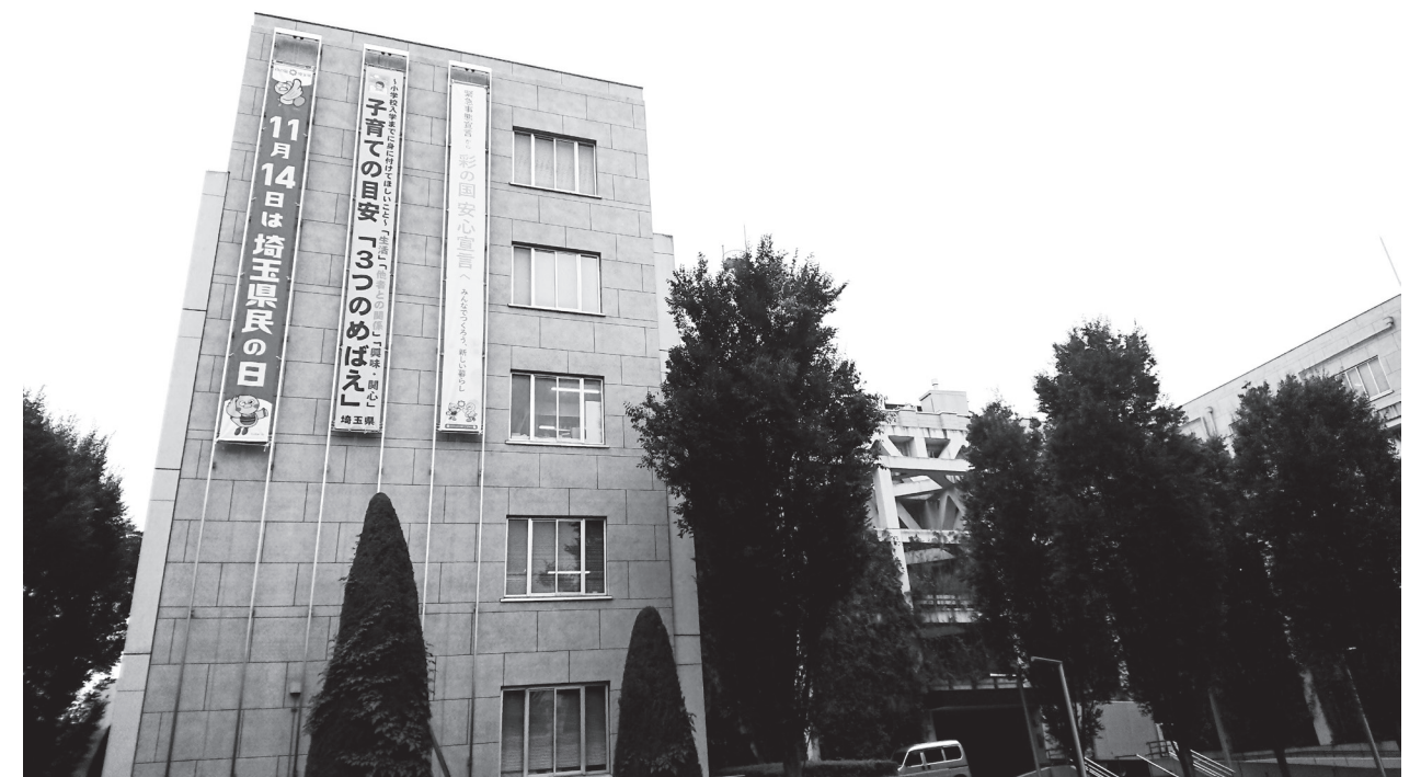
◎表紙写真／11月14日は埼玉県民の日（埼玉県庁 東玄関懸垂幕）

1871（明治4）年廃藩置県が行われ、11月14日（旧暦）に「埼玉県」が誕生したことから、ちょうど100年目にあたる1971（昭和46）年に制定された。